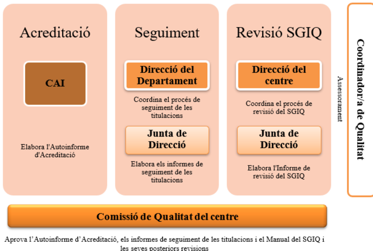
Figura 2. Òrgans i agents que intervenen en els processos d'avaluació del centre

La següent imatge mostra gràficament els òrgans que intervenen en els processos de qualitat així com les seves competències: